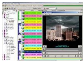
Etere Web Publishing screen

Этере Browsing – эффективное, мощное программное обеспечение, позволяющее нарастить модульные возможности системы автоматизации Этере Automation. Приложение Этере Browsing обеспечивает следующие основные преимущества: