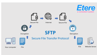
Secure File Transfer Protocol

Etere lance le protocole SFTP pour les transferts sécurisés de vidéos et de données. SFTP offre le plus haut niveau de protection contre les failles de sécurité à chaque étape du processus de transfert de données. Le lancement fait partie d'une mise à niveau gratuite par Etere, l'une des nombreuses mises à jour technologiques régulières qui sont déployées régulièrement pour maintenir votre système à la pointe de la technologie.