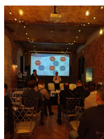
Etere at CSTB 2024