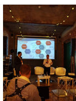
Etere at CSTB 2024