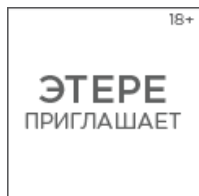
CSTB Pro Media 2024