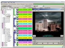
Etere Web Publishing screen

ETERE Browsing – эффективное, мощное программное обеспечение, позволяющее нарастить модульные возможности системы автоматизации ETERE Automation. Приложение ETERE Browsing обеспечивает следующие основные преимущества: