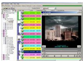
Etere Web Publishing screen

Этере Browsing – эффективное, мощное программное обеспечение, позволяющее нарастить модульные возможности системы автоматизации Этере Automation. Приложение Этере Browsing обеспечивает следующие основные преимущества: