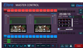
ETERE MASTER CONTROL