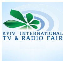
KYIV International TV & Radio Fair