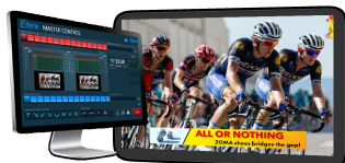
Channel in a box Etere ETX

CNBC Indonesia объявила об обновлении своей системы автоматизации воспроизведения до Этере 30.3, что обеспечивает новый уровень экономической эффективности и маневренности. CNBC Indonesia использует систему Этере с 2018 года. В следующем медиа-ландшафте вещательные компании внедряют технологии следующего поколения, чтобы учесть меняющиеся предпочтения в медиа потреблении и технологические достижения. Этере инвестирует в свои исследования и разработки, чтобы предоставить всем пользователям с контрактом на поддержку неограниченное количество обновлений и оптимизаций программного обеспечения. Этере поддерживает свою систему, чтобы обеспечить постоянную ценность, включая простые, быстрые и легкие обновления программного обеспечения до 4 раз в год. Кроме того, Этере гарантирует, что ваша система всегда будет оптимизирована для обеспечения максимальной производительности благодаря своей исключительной круглосуточной поддержке по всему миру.