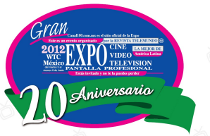
Expo Cine, Video y Televisión