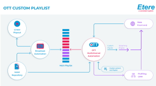
Etere OTT Delivery

Драйвер Этере SCTE-35 позволяет сшивать видеоконтент и целевую рекламу в один поток. Система автоматически определяет окончательные данные в SCTE-35 и сопоставляет их с данными списка воспроизведения, чтобы гарантировать, что содержимое широковещательной передачи всегда синхронизировано с содержимым списка воспроизведения. Впоследствии видеоконтент и целевые рекламные ролики объединяются в единый поток, чтобы зритель чувствовал себя комфортно. Система автоматически определяет окончательные данные в SCTE-35 и сопоставляет их с данными списка воспроизведения, чтобы гарантировать, что содержимое широковещательной передачи всегда синхронизировано с содержимым списка воспроизведения. Etere дает вам возможность заменять рекламу без повторного редактирования и перекодирования файлов мультимедиа.