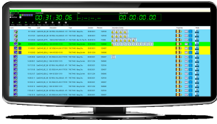
SCTE Signal on scheduling