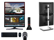
Sensorship Dual Monitor