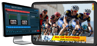
Channel in a box Etere ETX