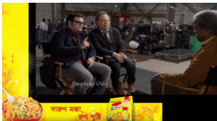
Ad Insertion Squeeze

Этере ETX-M Multiviewer отображает разрешение Ultra HD и позволяет одновременно управлять 9 дисплеями, мониторами и неограниченным количеством источников входного сигнала на одном экране. Кроме того, отображение следующего события позволяет вам предварительно просмотреть, что будет воспроизводиться дальше, позволяя редактировать и устраняя необходимость постоянно проверять список воспроизведения.