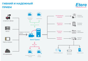
Этере Гибкий и надежный прием