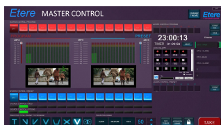
ETERE MASTER CONTROL diagram