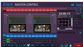
ETERE MASTER CONTROL diagram