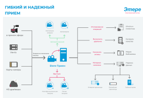
Этере Гибкий и надежный прием