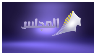
Al-Majlis TV Channel

Официальный телеканал Национального собрания Государства Кувейт расширяет возможности воспроизведения и управления медиа с помощью Этере 31.3.