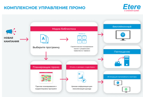
Этере Управление промо

Планировщик рекламных сообщений Этере - это передовой и надежный инструмент, который управляет рекламными размещениями для увеличения вашей аудитории.