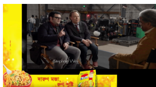
Ad Insertion Squeeze