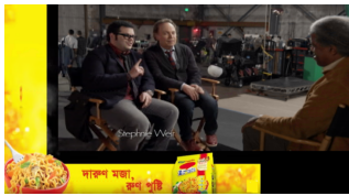
Ad Insertion Squeeze