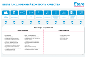
Этере Расширенный контроль качества

Расширенный контроль качества Этере - это экономичная система проверки качества видео, которая экономит время на задачах контроля качества за счет того, что нет необходимости повторно анализировать контент в случае изменения порогов.