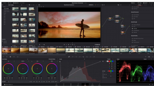
BMD Davinci Resolve

Этере продвигает вашу творческую работу с помощью современного решения между платформой Экосистемы Этере (Etere Ecosystem) и BMD Davinci Resolve.