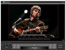
Asset Form Preview